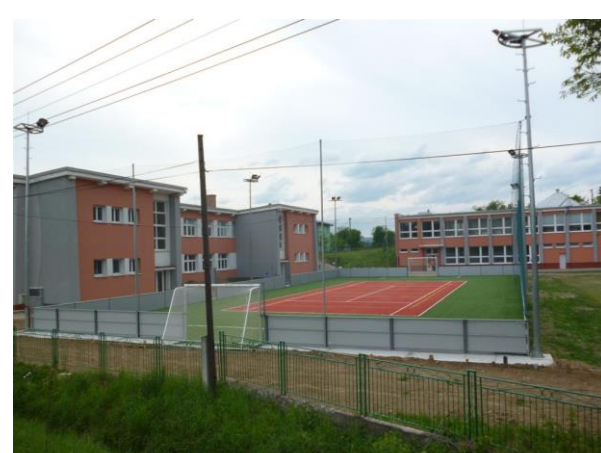
ZŠ Kotešová, multifunkčné ihrisko