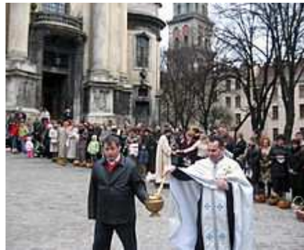
Požehnávanie paschálnych pokrmov

V gréckokatolíckej cirkvi sa Veľká noc tradične nazýva Pascha a je najväčším sviatkom cirkevného roka. Pasche predchádza Veľký týždeň (od Veľkého pondelka do Veľkej soboty). Najdôležitejšou bohoslužbou Paschy je utiereň vzkriesenia, ktorá sa slúži v nedeľu ešte pred východom slnka (na Slovensku a u východných Slovanov) alebo o polnoci zo soboty na nedeľu (na Balkáne). Pred ňou sa niekde zvykne slúžiť polnočnica, počas ktorej sa prenesie pláštenica zo stredu chrámu z katafalku (symbolického hrobu) na prestol (oltár), čo symbolizuje Kristovo vzkriesenie. Typickým obradom Nedele Paschy je aj posvätenie paschálnych (veľkonočných) pokrmov, ktoré sa väčšinou koná vonku pred chrámom. Na liturgii svätého Jána Zlatoústeho sa číta začiatok Evanjelia podľa sv. Jána v rozličných jazykoch. To symbolizuje, že radostná zvesť je určená všetkým národom. Obdobie Paschy trvá od Nedele vzkriesenia do stredy pred Nanebovstúpením Pána, teda 40 dní. V tomto období sa veriaci zdravia osobitným pozdravom Christós voskrése! – Voístinu voskrése! (po slovensky: Kristus vstal zmŕtvych! – Skutočne vstal zmŕtvych! ) Osobitne slávnostným je prvý týždeň tohto obdobia, ktorý sa nazýva Svetlý týždeň. [1] Tento týždeň platí voľnica.