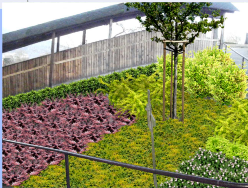
...:pohľad č. 2