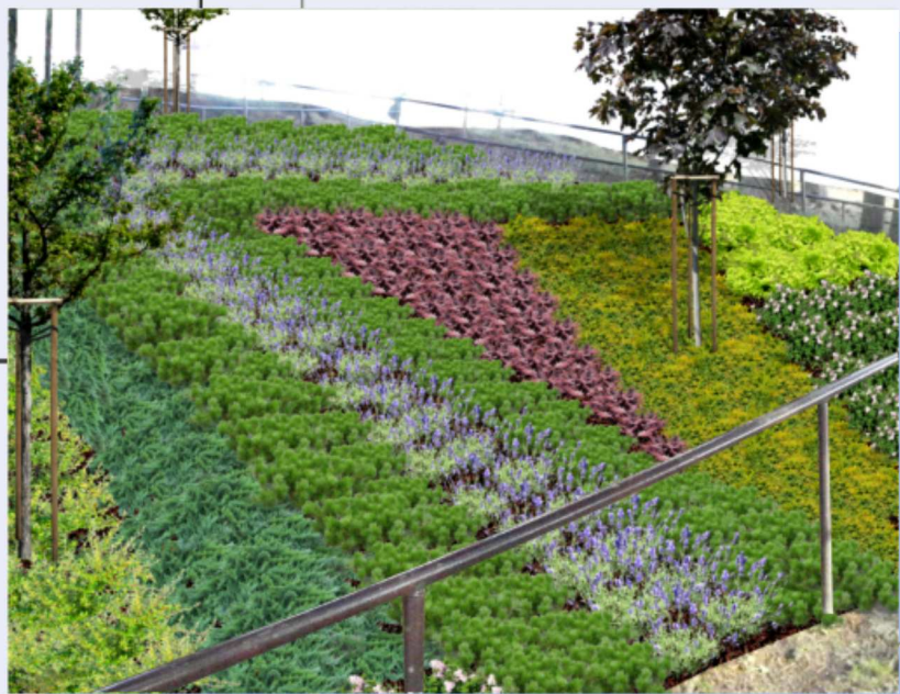
pohľad č. 1 :...

štúdiá verejného priestranstva revitalizácia kalvárie pri kostole